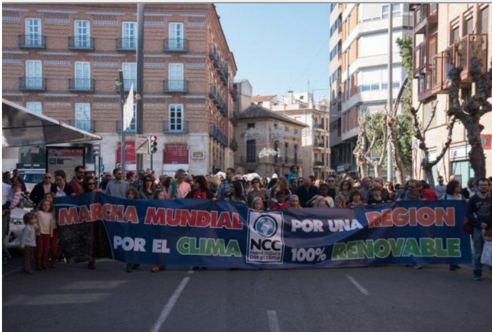
Marcha por el Clima ante la Cumbre de París.

La ciudad de Murcia se sumó ayer domingo a los más de 2.300 eventos y movilizaciones en todo el mundo ante la Cumbre del Clima que arranca hoy en París, con el objetivo común es exigir a los gobiernos un acuerdo que evite los peores efectos del cambio climático.